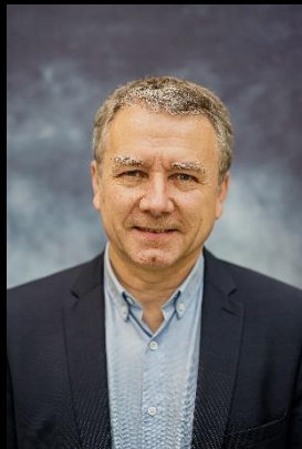
Francis COMBY Président de la Communauté de Communes du Pays de Lubersac-Pompadour.