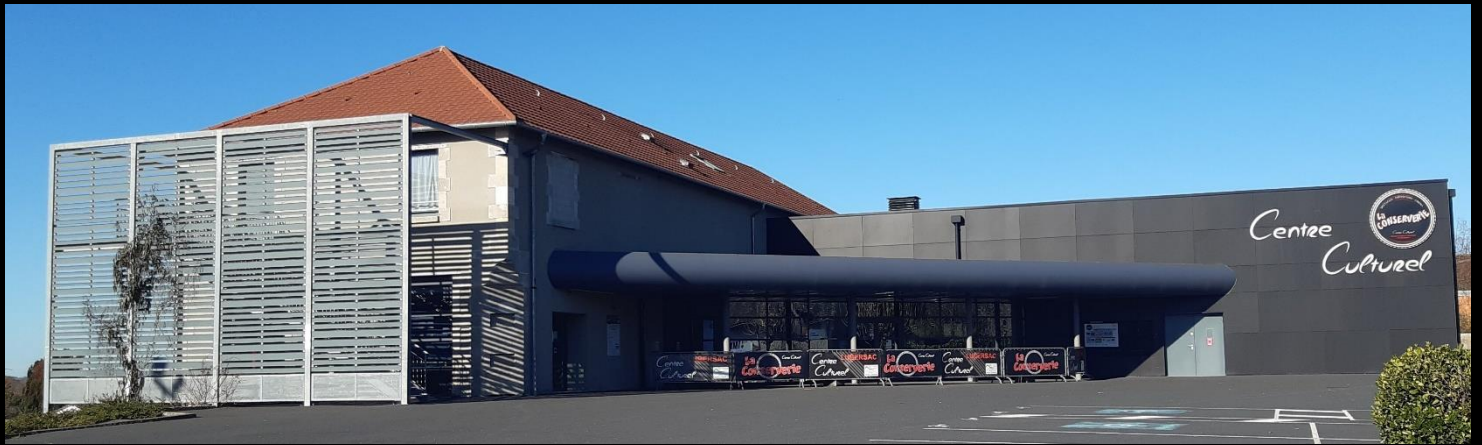
Espace accueil et billetterie