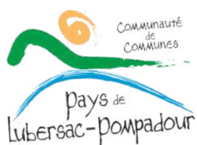
Francis COMBY Président de la Communauté de communes du Pays de Lubersac-Pompadour